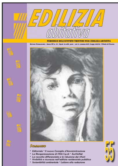
Foto 1ª di copertina